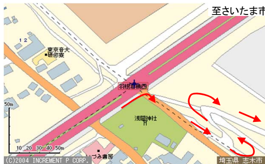
(羽根倉橋西信号付近詳細図)