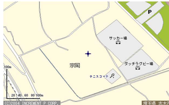
(志木市秋ヶ瀬運動公園配置図)