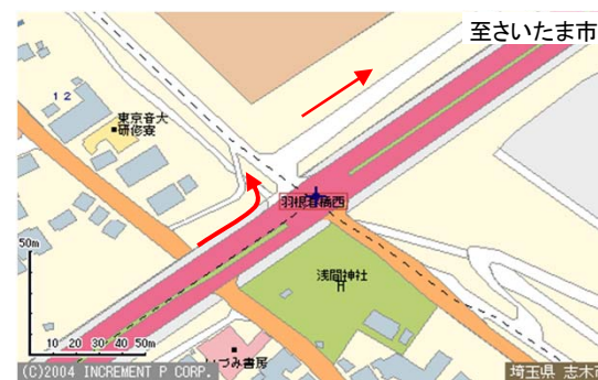
浦和所沢バイパス 羽根倉橋西信号付近詳細図